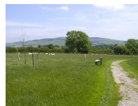
Back to nature