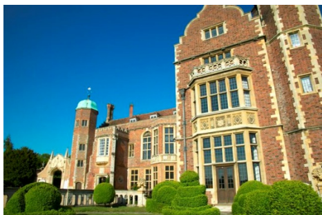
Mandingley Hall Cambridge

2 overnachtingen (1- persoonskamer) op karakteristieke locaties